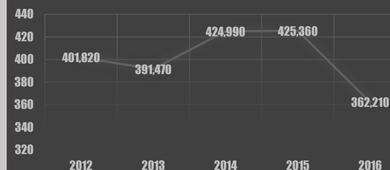
Směsný komunální odpad - vývoj

KOMPLETNÍ A AKTUALIZOVANÉ INFORMACE NALEZNETE ZDE: http://www.hodonice.cz/zivotni- prostredi/nakladani-s-odpady/