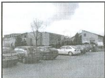
Rekonstrukce kulturního domu i přes nepřízeň počasí bude mít do konce března splněnu 1. etapu. Ihned začne 2. etapa týkající se přestavby stávajících vnitřních prostor.