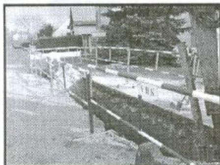
Pokládá se poslední úsek dešťové kanalizace na ulici Nádražní od hospody U Karla směrem k Haivě. Následovat bude vybudování chodníku a nový povrch silnice. Termín dokončení květen 2009.