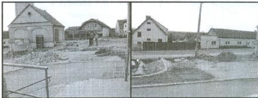
Rekonstrukce návsi u Renty také finišuje. Zde by práce včetně čekárny měly být dokončeny koncem dubna.