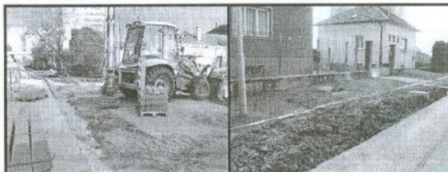
Za sladovnou se dokončuje splašková kanalizace, která je skoro hotová. Termín plánovaného dokončení je duben až květen 2009.